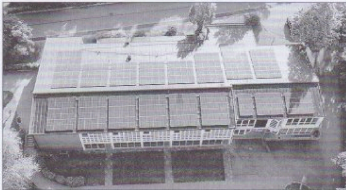
Montierte Solar-Panels auf dem Dach der Stadthalle Vellberg

Vereinbarungsgemäß wurde der Start-Termin für den Gerüstaufbau und die Dacharbeiten bei PV-Projekt1 „ Stadthalle Vellberg “ und PV-Projekt2 „ Kindergarten Talheim “ aus Sicherheitsgründen in die Pfingstferien gelegt (zum Eigenschutz der Kinder wg. evtl. „Kletterunfälle“ an den Baugerüsten). Dort sind nun alle Photovoltaik-Module bereits vollständig auf den Dächern montiert.